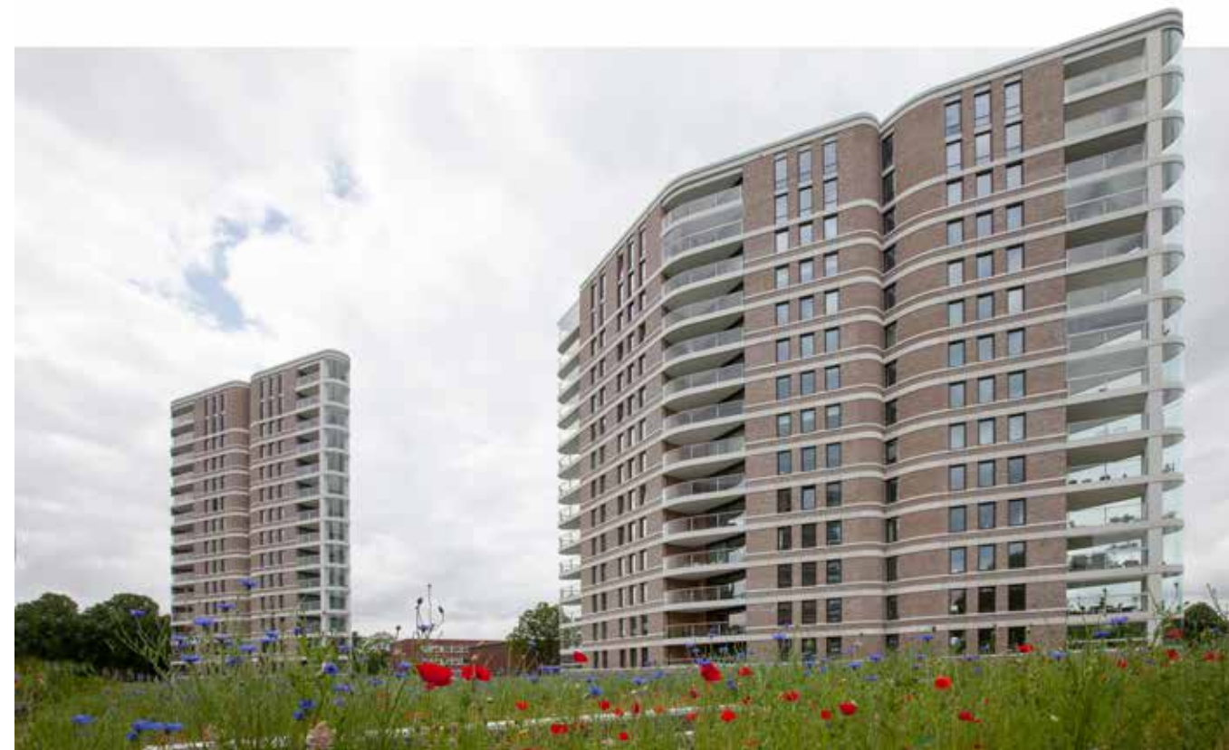
‘Groen heeft veel meer functies dan je zou denken.’

‘GROEN ZORGT VOOR EEN PRETTIGER LEEFKLIMAAT’