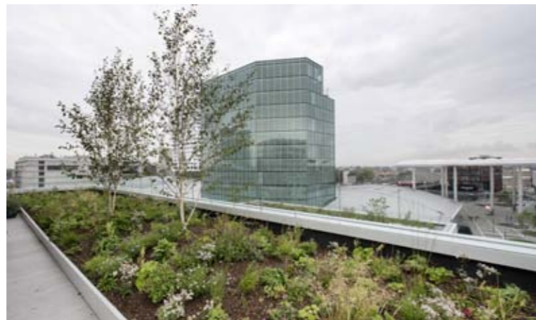
Daktuin Het Platform in Utrecht