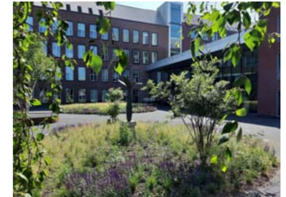
Daktuin Bastion in 's-Hertogenbosch: Advies door idverde Advies & Realisatie door idverde Realisatie, vestiging Haaren.