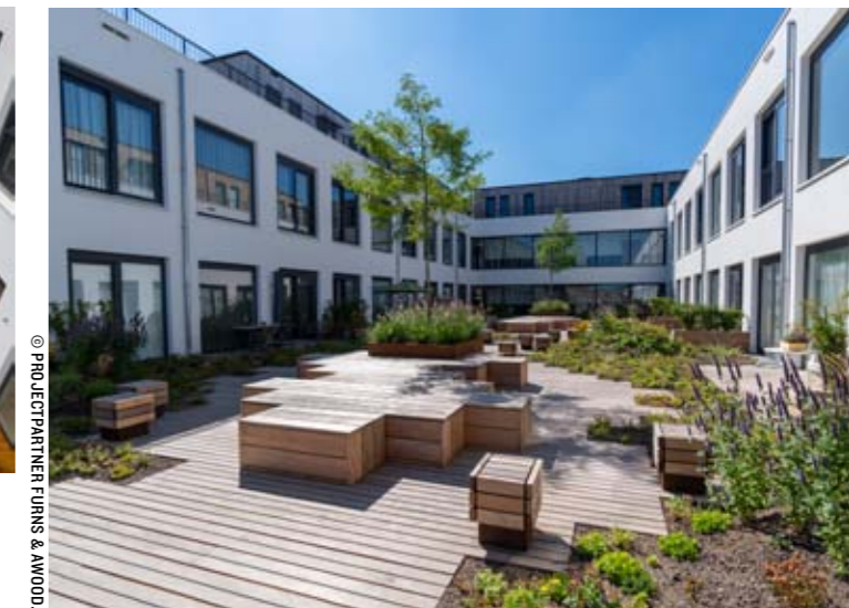
Links en boven; aanleg & realisatie van Anno52, voormalig winkelpand van V&D, Bergen op Zoom